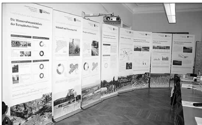
Wanderausstellung des Landesamtes für Umwelt, Landwirtschaft und Geologie (LfULG) zur EU-Wasserrahmenrichtlinie, Foto: LfULG

Weitere Informationen zur Ausstellung und zum Projekt finden Sie unter www.baeche-lebensadern.de