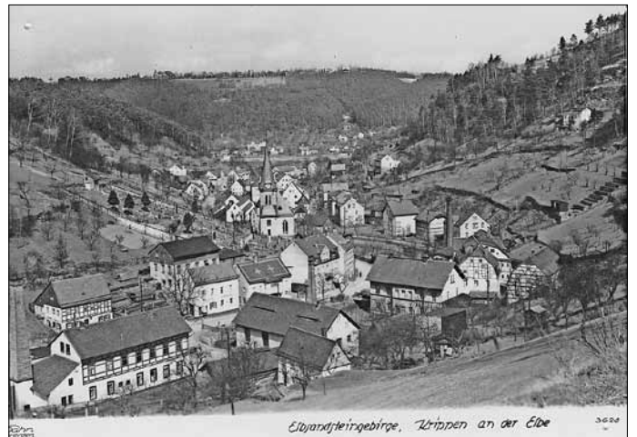
Das Krippener Mitteldorf um 1935, rechts im Bild das Fabrikgebäude mit dem auffälligen hohen Industrieschornstein

Für Krippen ist die Geschichte dieses Objektes geradezu ein klassisches Beispiel für die technischen, wirtschaftlichen und gesellschaftlichen Umwälzungen, die typisch für das Industriezeitalter des 19. und 20. Jahrhunderts waren. Die moderne Wasserturbine löste hier das traditionelle Wasserrad ab, später kamen eine Dampfmaschine und schließlich der Elektromotor als Antriebsmittel für die Arbeitsmaschinen hinzu. Allein an der Vielfalt der Produkte und an den kurzen Zeitabständen der Produktumstellungen lässt sich das damalige Industriertempo anschaulich verdeutlichen und nachvollziehen.