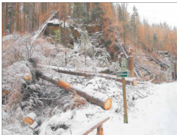
Wie hier im Kleinen Zschand sind auch an anderen Hauptwanderwegen im Nationalpark umfangreichere Arbeiten zur Verkehrssicherung erforderlich

Zurzeit führen Mitarbeiter der Nationalparkverwaltung und beauftragte Firmen in allen Gebietsteilen des Schutzgebiets Verkehrssicherungsmaßnahmen in größerem Umfang durch. Die Stürme Herwarth und Frederike, das Borkenkäferjahr 2018 mit vielen abgestorbenen Fichten und jetzt neuerliche Schneeburche stellen die Revierleiter im Nationalpark vor große Herausforderungen.