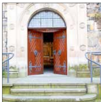
Bad Schandau: Reinhardtsdorf:

jeden Dienstag 15.00 Uhr jeden Dienstag 17.00 Uhr