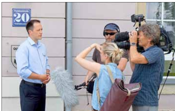
Bürgermeister Thomas Kunack im Interview für den mdr