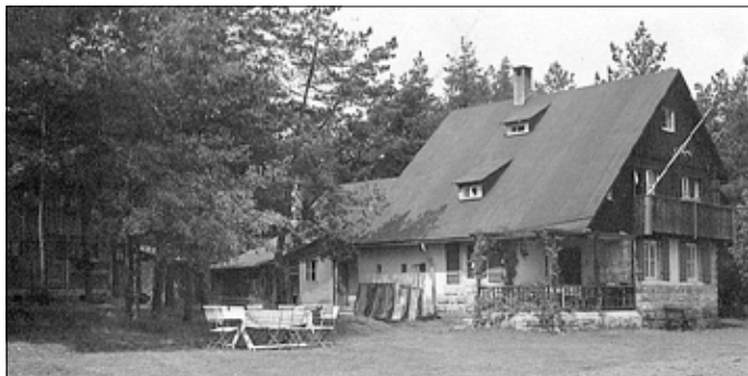
Pension Reuterhof um 1940