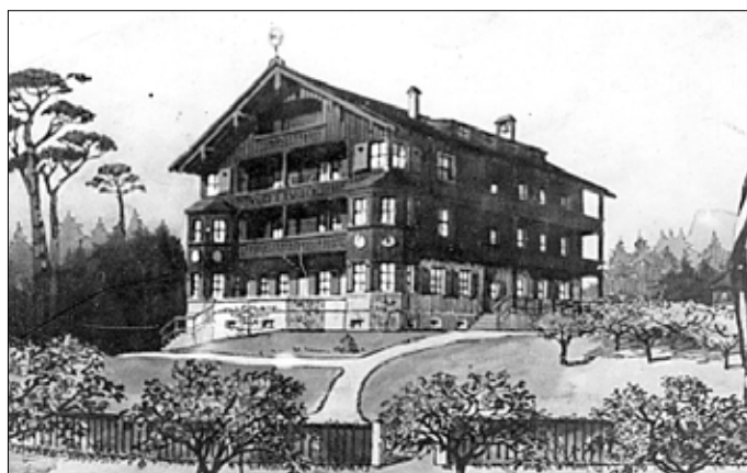
Entwurf des geplanten Erholungsheimes

Die Absichten seitens eines Dresdner Frauenvereins bestanden darin, nach dem Ersten Weltkrieg am Marktweg in Schöna, auf „Krauses Hübel“, ein Erholungsheim zu errichten. Dieser Plan konnte nicht verwirklicht werden.