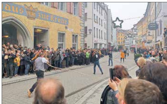
Foto: SV Bad Schandau - traditioneller Start der Narrenzeit, dass so genannte Einschnellen

Bei den vielen interessanten Gesprächen wurde mir wieder einmal mehr bewusst, dass trotz der weiten Entfernung eine herzliche Verbundenheit zwischen den Partnerstädten besteht. Davon können Sie sich gerne anlässlich des 30-jährigen Jubiläums unserer Städtepartnerschaft vom 12. - 14. Juni 2020 persönlich überzeugen. Sie sind herzlich eingeladen, mit uns nach Überlingen zu reisen. Da wir nur begrenzte Kapazitäten zur Verfügung haben und die Zimmerreservierung rechtzeitig erfolgen muss, bitten wir Sie, sich bis spätestens 07.02.2020 zu dieser Fahrt verbindlich telefonisch unter 035022 501-125 oder per E-Mail unter buergermeisteramt@stadt-badschandau.de anzumelden.