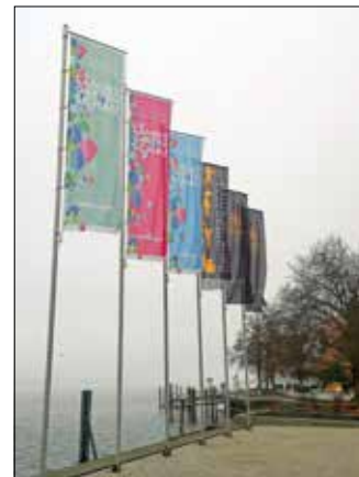
Promenade am Bodensee

Zum diesjährigen Dreikönigstrunk war gleichzeitig der Startschuss der Stadt Überlingen zum Jubiläum „1250 Jahre Überlingen“, des heraufziehenden Narrentags des Viererbunds und der im April beginnenden Landesgartenschau. Zu den geladenen Personen aus Wirtschaft und Politik waren auch traditionell die Sternensinger im historischen Ratssaal zu Gast.